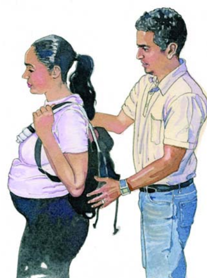
Mejico colocando la mochila a la madre