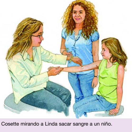
Cosette mirando a Linda sacar sangre a un niño.

Lláme al número 311 y pída que le pasen al HPD